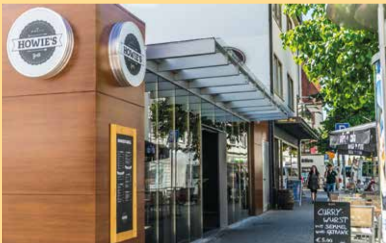
Howie's Grill • Hafenbad 10 • 89073 Ulm • www.howies-grill.de