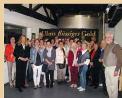
„Politik mit Frauen“-Gruppe aus Marbach