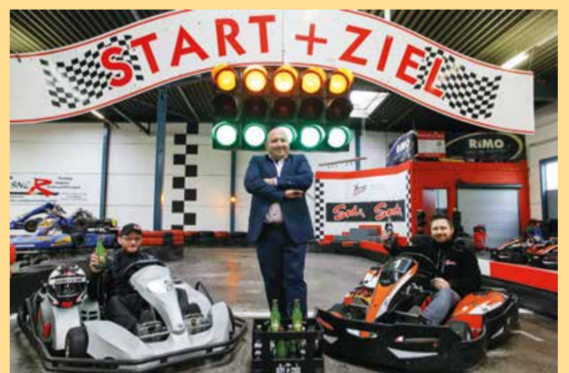
Kartbahn Alemannenring • Am Rehbeck 2 • 78224 Singen • Tel. 07731-9454735 www.kartbahn-alemannenring.com

Portfolio. Veranstaltungen wie Ü50-Rennen oder das Girls Race sind Besuchermagnete. Insgesamt stehen 12 sogenannte Ticketkarts mit 6,5 PS und weitere 14 Rennkarts mit 9 PS zur Verfügung. Das Bistro im ersten Stock lädt nicht nur Piloten zur Pausen-afri-cola und Bluna mit einem grandiosen Blick über die gesamte Indoor-Rennstrecke ein.