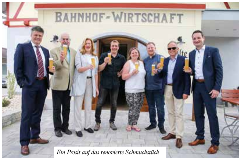
Ein Prosit auf das renovierte Schmuckstück