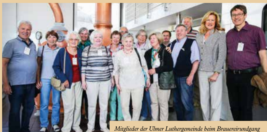
Mitglieder der Ulmer Luthergemeinde beim Brauereirundgang