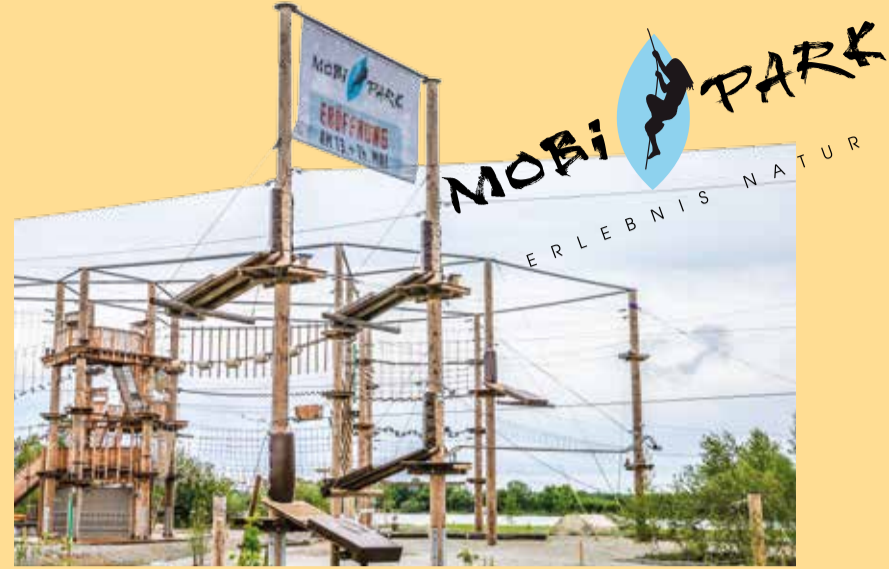
Mobipark GmbH • Kieswerk 1 • 88471 Laupheim • Tel. 0172-6498675 • www.mobipark-laupheim.de