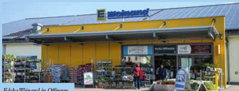
Edeka Weinand in Offingen