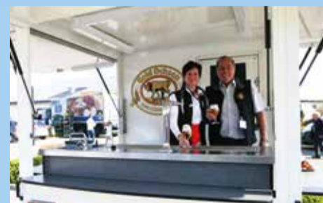
Gold Ochsen Ausschank zur Wiedereröffnung