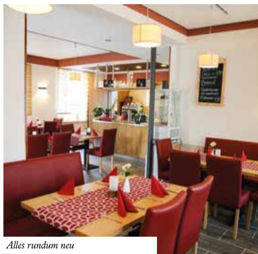
Alles rundum neu