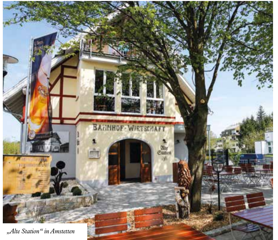
„Alte Station“ in Amstetten