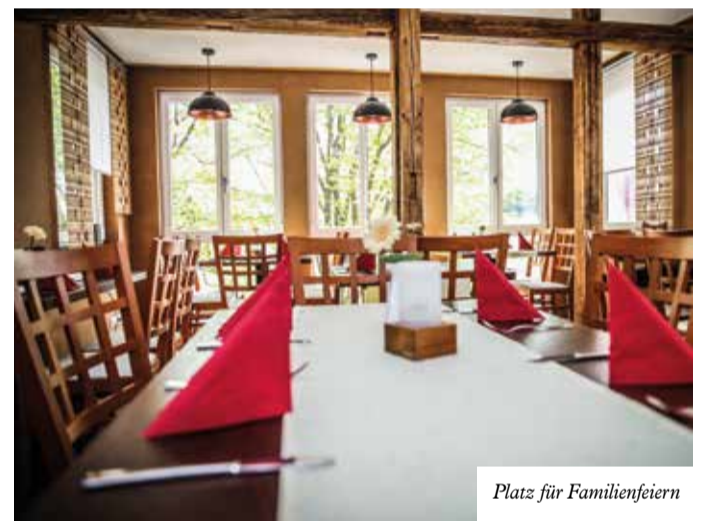
Platz für Familienfeiern